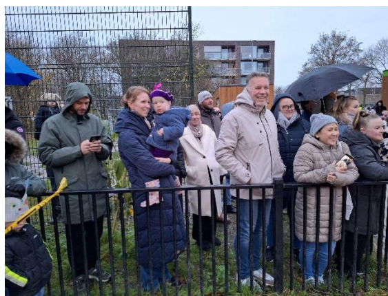
Ook voor de ouders is het altijd weer spannend!

De kinderen waren diep onder de indruk van die man in z'n rode mantel. En dan ook nog die springende pieten erbij. Maar toen de pieten pepernoten gingen uitdelen, was het ijs meteen gebroken!